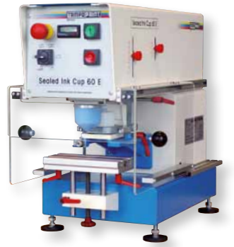
"Sealed Ink Cup 60 E"