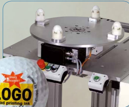
Döner tabla "T4" üretimizi artırır!