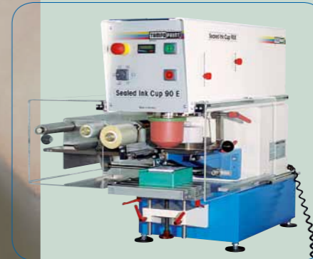
Malzemeye özel konumlandırıcı - baskı kalitesini artırır