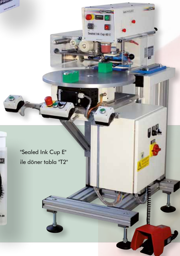
"Sealed Ink Cup E" ile döner tabla "T2"