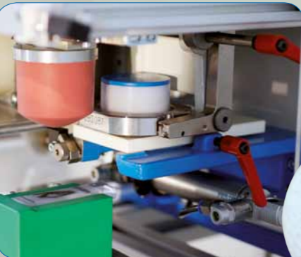
Cliplock hazne - kullanımı kusursuz, yerinden oynatmadan boya konabilir!