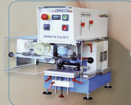
Temizlik, hatalı baskılara son - silikon temizleme aparatı ile