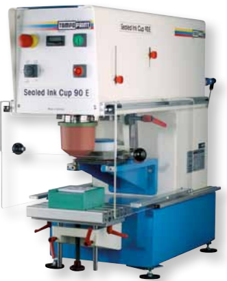
"Sealed Ink Cup 90 E"